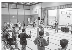
生きがい活動納涼祭

内容：健康チェック、入浴、昼食、休養、軽運動、各種レクリエーション行事など ※月に3～4回、マイクロバスで送迎します。