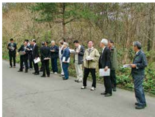
候補地の現地踏査

委員からは、「隣接施設と連携した取り組みにより環境教育等への活用が期待できる。」「有効敷地内にも急峻な箇所があり、十分な調査や対策が必要になると思われる。」など、候補地の利点や課題について意見が出されました。現地踏査によって得られた情報や意見等については、次回の会議資料や検討結果報告書に反映することとしました。