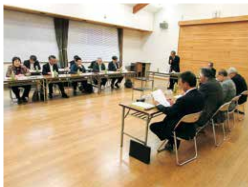
第8回一般廃棄物処理施設整備検討委員会

委員会において、二次選定及び三次選定の評価や候補地の利点・課題を整理した結果、2箇所を有力候補地として選定しました。