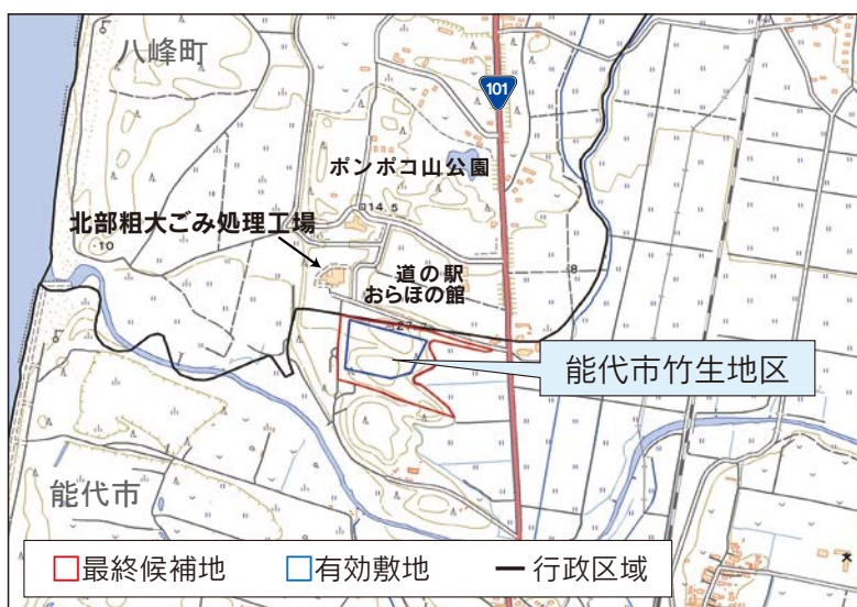
最終候補地の位置図

能代山本広域市町村圏組合では、平成30年11月30日に開催した理事会において、新たなごみ処理施設の最終候補地を「能代市竹生地区」に決定し、12月20日の組合議会全員協議会へ報告いたしました。