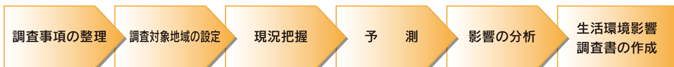
生活環境影響調査の流れ