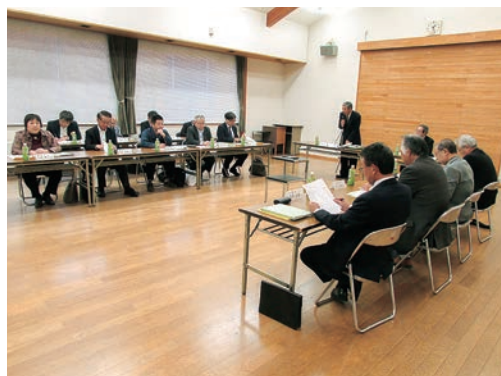
第8回一般廃棄物処理施設整備検討委員会

委員会において、二次選定及び三次選定の評価や候補地の利点・課題を整理した結果、2箇所を有力候補地として選定しました。