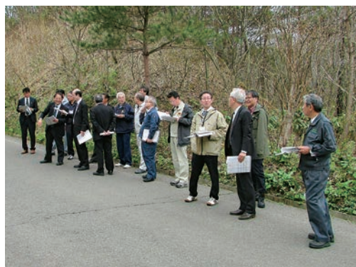
候補地の現地踏査

委員からは、「隣接施設と連携した取り組みにより環境教育等への活用が期待できる。」「有効敷地内にも急峻な箇所があり、十分な調査や対策が必要になると思われる。」など、候補地の利点や課題について意見が出されました。現地踏査によって得られた情報や意見等については、次回の会議資料や検討結果報告書に反映することとしました。