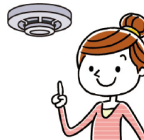
定期的な作動確認

作動確認をしても警報器に反応がなければ、本体の故障か電池切れです。（※2）警報器の本体又は電池を交換しましょう。