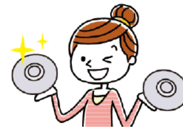
古くなったら交換