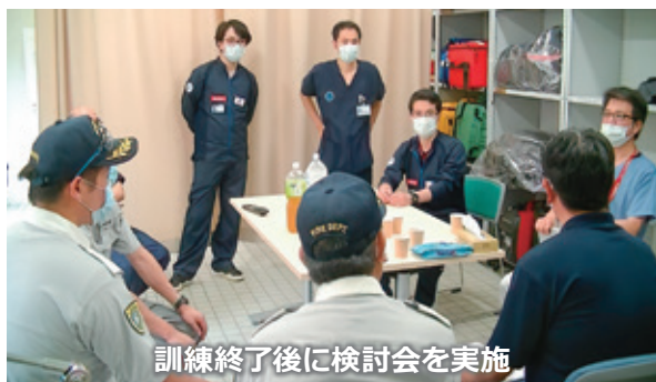
訓練終了後に検討会を実施