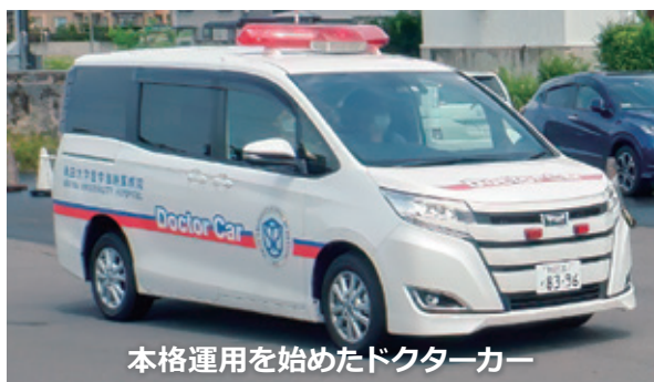
本格運用を始めたドクターカー