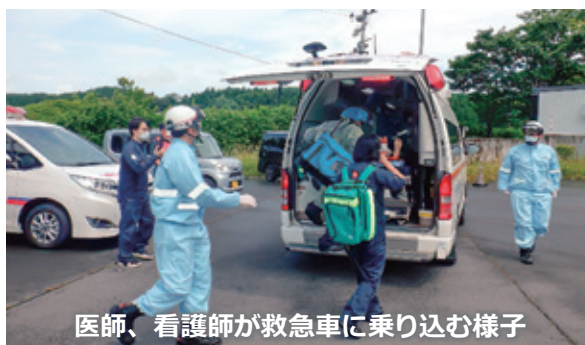
医師、看護師が救急車に乗り込む様子