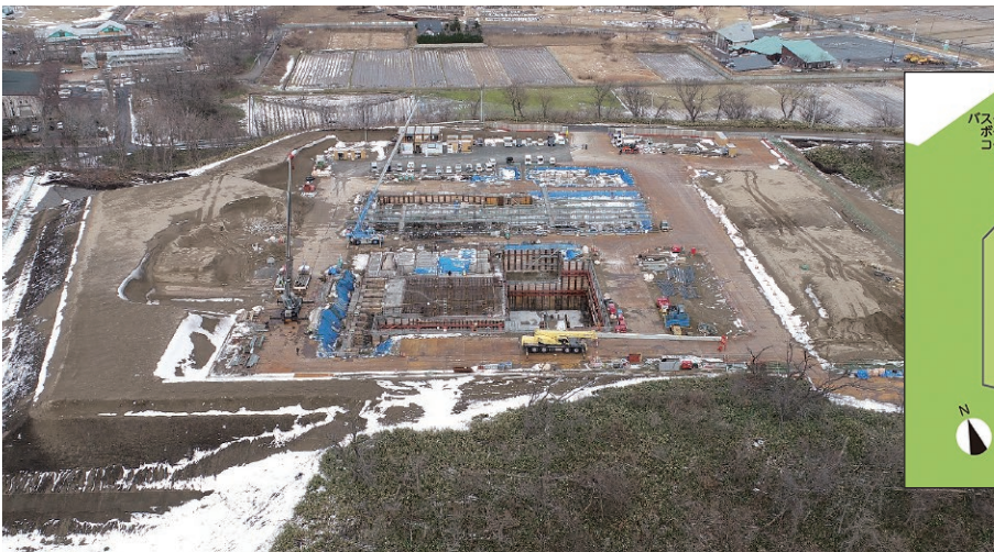
建設地全景（令和6年1月11日撮影）

令和5年度から土木・建築工事が始まり、令和6年度からはプラント工事も始まります。今回は令和6年1月現在の工事の状況をお知らせします。